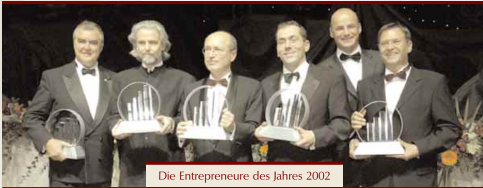
Die Entrepreneure des Jahres 2002

Werden Sie „Entrepreneur des Jahres 2003“